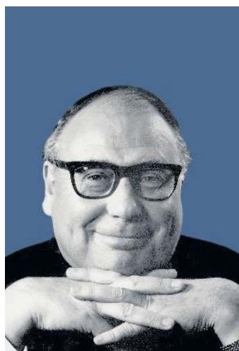
Heinz Erhardt – der König des Humors

Info: Eintrittskarten für diese Lesung am Montag, 13. Januar, um 19.00 Uhr, im Kurhaus Bad Steben sind an der Abendkasse erhältlich mit Gastkarte für 8 Euro (ohne Gastkarte 9 Euro).