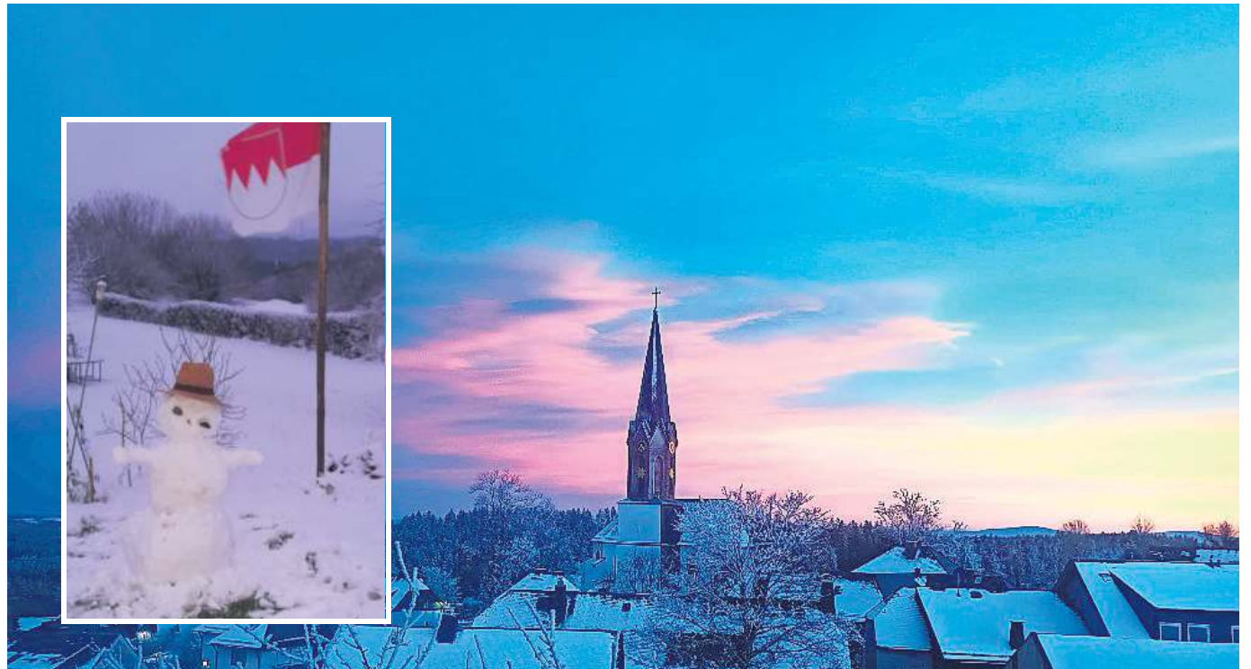
Winterträume in Zartrosa-Violettblau