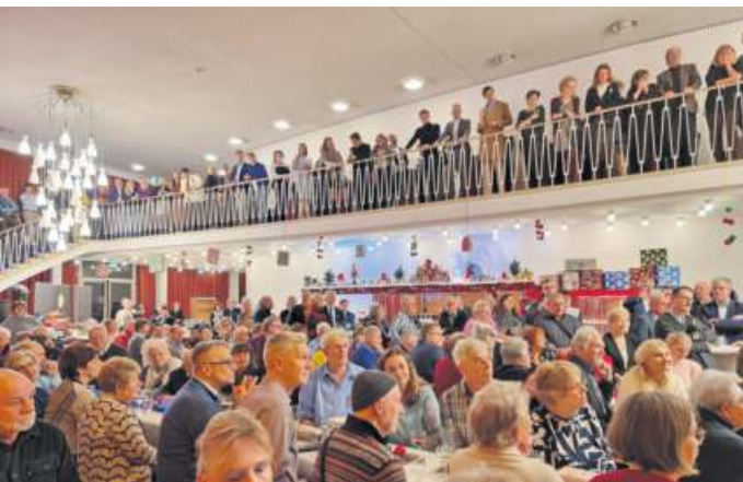
Ehrenamtsempfang im Foyer des Ernst-Reuter-Saales.

für seine „Kaffeewette“ zugunsten der Berliner Stadtmission ausgezeichnet.