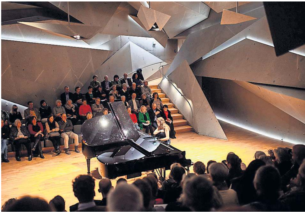
Das neue Jahr startet mit vielen Abschlusskonzerten im Konzertsaal von Haus Marteau.