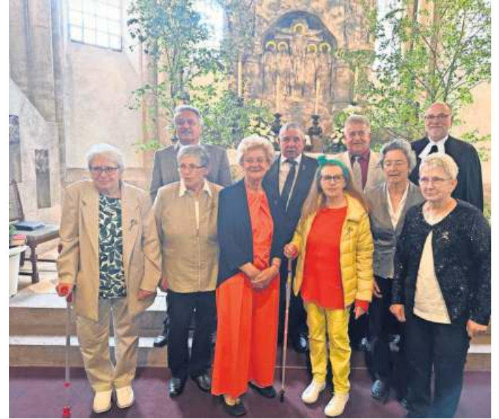
Die Goldenen (Foto links oben), Diamantenen (Foto rechts oben) und Gnadenen Konfirmanden (Foto rechts) bekräftigten mit einem Festgottesdienst in der Lutherkirche Bad Steben am 1. Juni ihr Ja zum christlichen Glauben. In der Predigt stand ein Bibelvers aus Psalm 73 im Mittelpunkt: „Aber das ist meine Freude, dass ich mich zu Gott halte.“